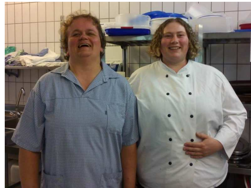
in einem Seniorenheim in Bad Wörishofen